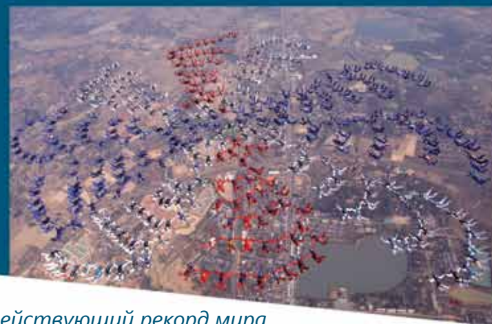
Действующий рекорд мира. Формация - 400 человек. Таиланд. 2006 год