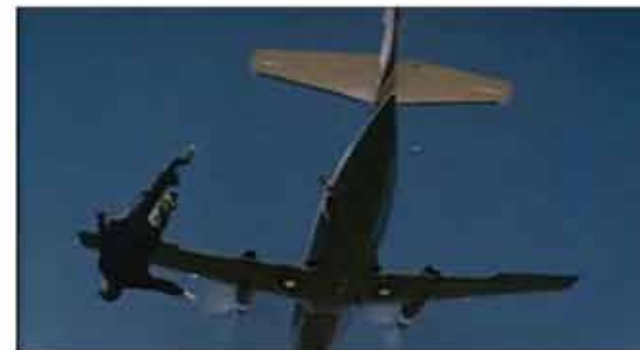
Кадр из фильма «Лунный гонщик»